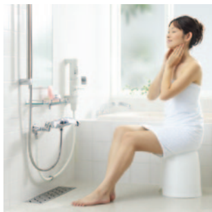
リンナイ ガス給湯器のお湯を使うシンプルミスト RU-MIST (25-7586)

美容効果で お肌はツヤツヤ、お化粧ノリもバッチリ に。発汗量は普通の入浴の 1.5倍 以上にもなります。 ストレス